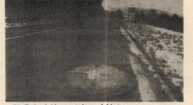
Bir Federal Alman otobanındaki atom mayını yuvası.

Bu yazının başlığı F.Almanya'da Hessen eyaletindeki barış yanlılarının son günlerde sık sık kullandıkları bir slogan. Barışçılar bu sloganı televizyondaki çimento reklamlarından Amerika'nın Almanya'da bulunan 5. tümeni bir savaş sırasında "düşmana" ağır kayıplar verdirecekleri geri çekilmek için bu yuvaların kapaklarını açacak, içine 15 kilotonluk atom mayını yerleştirecek ve patlatacak. Patlama kilometrelerce karelik bir alanda tüm hayatı bir anda yok edecek